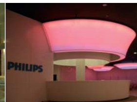
Arch. : Kingsmen Projects Pte LTD