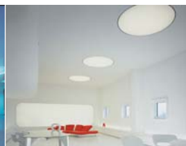
Arch. : Academia Design Centre - Okan Kologlu