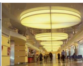
Arch. : Hakan Kiran