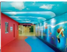
Arch. : Arch Tube Architectural Lighting & Design