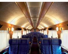
Arch. : David Betts & Paolo Dario

Visto que as cores foram imprimidas pode haver diferenças com a realidade, por isso a nossa carta de cores com amostras de tela está ao seu dispor. Os reflexos das telas lacadas podem variar em função das formas, separações e outros. A largura des telas sem soldadura pode variar entre 1m50 até 2m56 segundo a acado de tela escolhido. É favor consultar a tabela das larguras de tela para conhecer as medidas exactas. Segundo a intensidade de exposição ao brilho solar, da composição da atmosfera (fumo...) da peça, a côr pode variar com o passar do tempo.