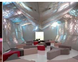
Arch. : Studio Arne Quinze