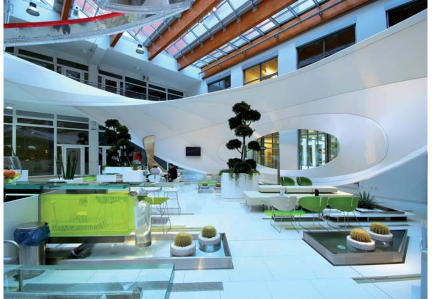
ARCHITECTE : FEDERICO DIAZ