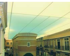
Arch. : Murat Denizati