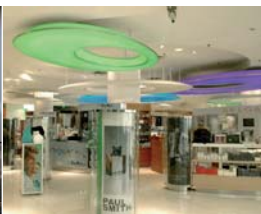
Arch. : ECO° ID