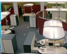
Arch. : Brett & Partner