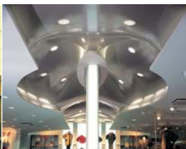
Arch. : Gilles Morais