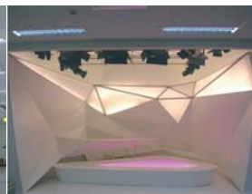
Arch. : Tim Power