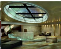
Arch. : The Syntax Group UK