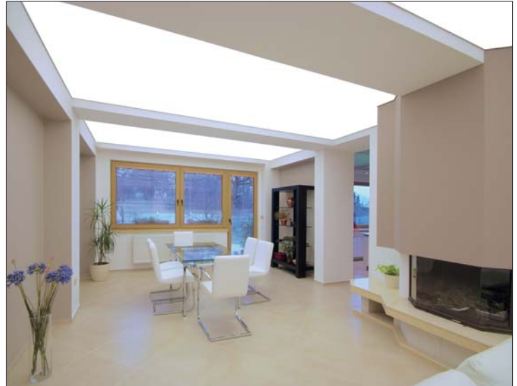
DESIGN : C.S. LYON PRAHA DESIGN

Die gedruckten Farben können in der Realität von der Darstellung abweichen; eine Broschüre mit Muster ist für genauere Abgleiche erhältlich. Der Spiegeleffekt der Lackfolien kann je nach Form, Aufteilung und weiteren Faktoren variieren. Die Folienbreite ohne Schweißnaht variiert je nach Folientyp zwischen 150 cm und 256 cm. Bitte überprüfen Sie die genauen Abmessungen in der Tabelle mit den Breitenangaben. Abhängig von der Sonneneinstrahlung und der Luftzusammensetzung im Raum (Rauch...) kann sich das Erscheinungsbild der Folien zeitlich ändern.